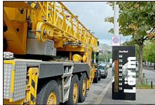
Eine Lärmmessanlage informiert Passanten über den Dezibelwert.

Ein Messpegel der kantonalen Fachstelle Lärmschutz soll bis Ende Oktober die Fahrer nun darauf aufmerksam machen, wie viel Krach sie verursachen. Den «gehörten» Lärm können die Fussgänger und Lenker so mit dem gemessenen Dezibelwert vergleichen. «Wer niedrigtourig fährt, verursacht am wenigsten Lärm», heisst es bei der Fachstelle.